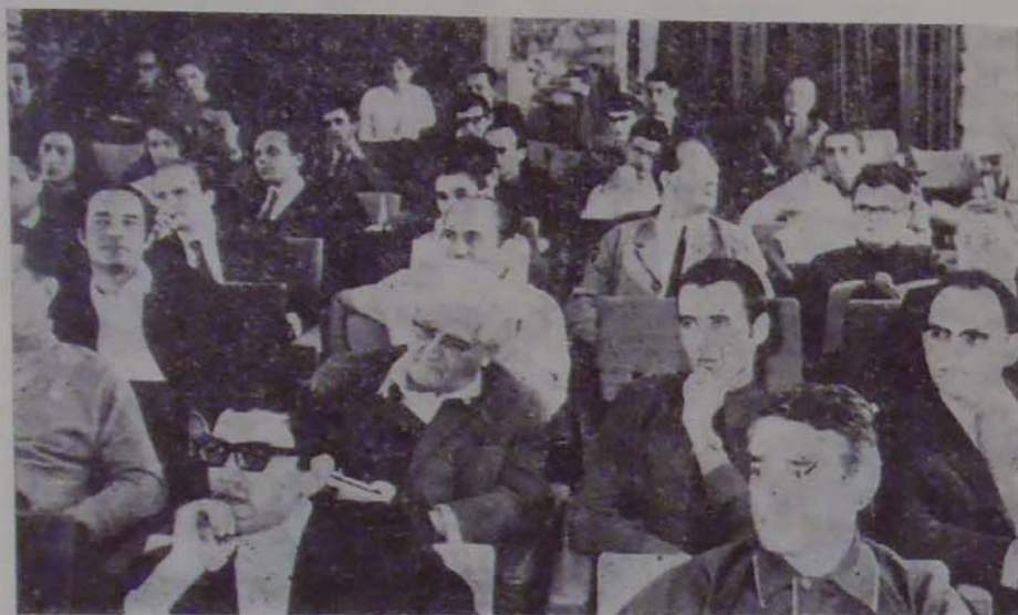
A résztvevők érdeklődéssel hallgatják a szeminárium előadóját