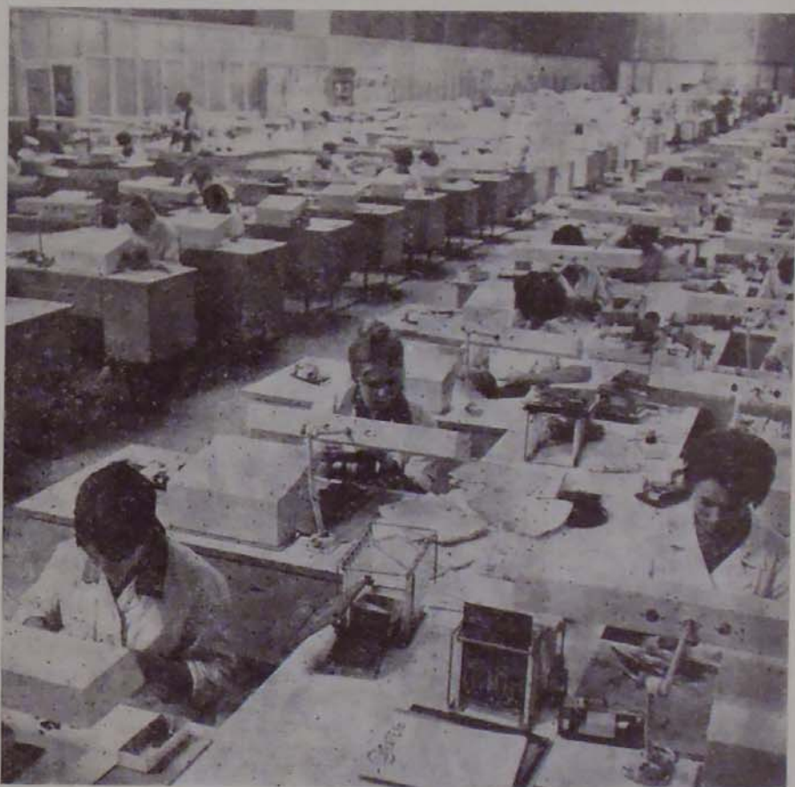
Szerelőműhely a Kijevi Számítógépgyárban