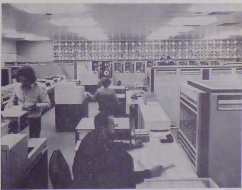
Míg a müncheni olimpia külső területe még egyetlen óriási építkezési hely képét mutatja, a stadion egy helyiségében már 1971 áprilisában megkezdődött a Siemens számítóközpont próbadüzeme. A képen azok a számítógépek láthatók, amelyekhez majd az 1972. évi nyári olimpiai játékok idején a sportolók teljesítményadatait mind a 31 küzdőteréről távgépirón befutnak. A számítógép azonnal rendezti az adatokat, és rövid időközönként — ugyancsak távgépirón keresztül — továbbítja az eredményeket a sajtóközpontba. A Siemens versenyrendszer ezen felül egyebek között automatikusan megadja a versenyzők helyezését, szemlélteti az ökölvívás, a eselgáncs, a birkózás és a vívás sportágakban küzdő versenyzők párosítását, valamint jelzi, ha új olimpiát, illetve világrekordot sikerült elérni.

fa-lu épületei láthatók, ahol 12 000 sportoló és kísérők nyernek el-