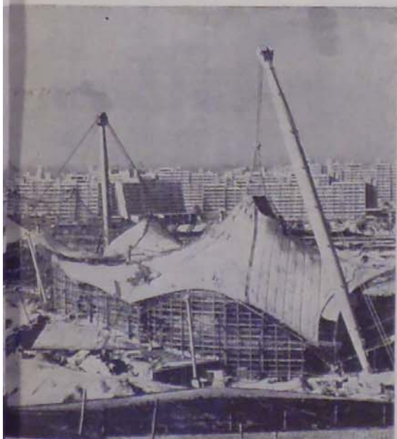
felelnek egymástól a sportcsarnok és a versenyszüda. A két léteúra „parádés darabja”, a sátorfelő köli össze egymással. A sporteseményeket és a kézilabda-mérkőzéseket bonyolítják le, 12 000 nényuszodában 8000 néző láthatja az úszóversenyeket és a víziúgrók és toronyúgrók versenyét.

fa-lu épületei láthatók, ahol 12 000 sportoló és kísérők nyernek el-