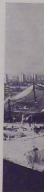
Csak néhány sátrényt az olimpián, amely zónák biztosít h labda-döntőket, A háttérben helyezést.