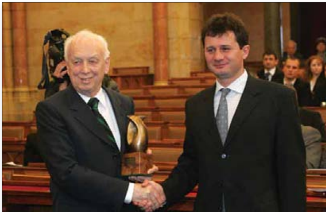
Az Innovációs Nagydíjat Mádl Ferenc (balra) adta át Duda Ernőnek.