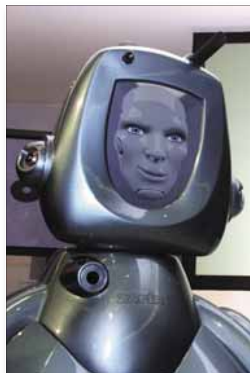
A vendégeket fogadó hostess-robot

A kiállítás megtervezésénél igyekeztünk olyan anyagot összeállítani, hogy felkeltse mind a fiatalabb korosztályok, mind a felnőttek fi-