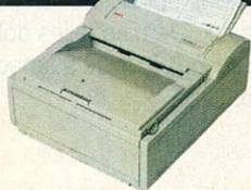
OKIPAGE 6e/6ex 6 lap/perc 600 dpi