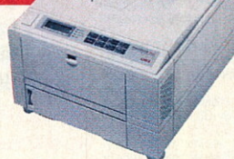
OKIPAGE 16n/20n 16/20 lap/perc 600×1200 dpi