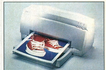
420c: a nyomtatás öröme

A DeskJet sorozat tízéves évfordulóját ünnepli idén. Tagjai kezdetben egyszerűen használható, szövegorientált nyomtatók voltak.