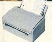
OKIPAGE 4w Plus 4 lap/perc 600 dpi