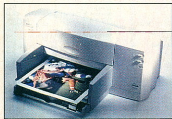
710C: megbízható munkatárs otthonra

A 710C típusjelű nyomtató ideális otthoni munkatárs: percenként hat fekete, illetve három színes oldal nyom-