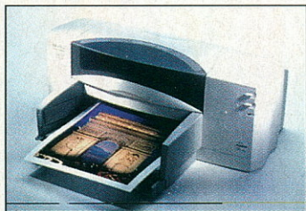
DeskJet 895Cxi: üzleti partner az irodába

A DeskJet 895Cxi Professional Series nyomtatót olyan irodákba szánják, ahol fontos a hálózati kapcsolódás lehetősége, illetve több felhasználó kiszolgálása jó minőségű színes nyomatokkal. Poszt nyomtatásra is képes. Percenkénti kilenc fekete-fehér, illetve hat színes lapos sebessége elegendő kisebb csoportok kiszolgálására. Igazi újdonság, hogy a DeskJet 895Cxi a HP Jet-