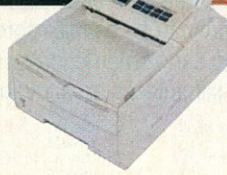
OKIPAGE 10i 10 lap/perc 600×1200 dpi