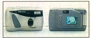
HP PhotoSmart C20: okos fényképezőgép

minőségű képeket kaphatunk vele. A készülék érdekessége, hogy a letárolt képeket tévén is megnézhetjük. A beépített CCD felbontása 1152x872 képpont, 24 bites színelbontású, és mechanikus zár gondoskodik az élesebb képekről. A C20 beépített vakut is tartalmaz. 4 Mbyte-os CompactFlash kártyát használ, de ha több képet szeretnénk rögzíteni, akkor 10 Mbyte-osat is kaphatunk hozzá. A hátoldalon lévő 4,6 cm átlójú LCD képernyőn megtekinthetjük, milyen lesz a kész kép.