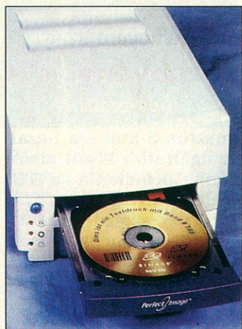
Perfect Image: száz kópia

A készülékek ideálisak lehetnek nagyobb oktatási intézmények, vállalatok részére, ahol nagy mennyiségű digitális adatot kell terjeszteni, de a szükséges másolatok száma nem éri el a CD-gyártás által megkövetelt minimális darabszámot. A készülékek személyi számítógépről vezérelhetők, és a legkülönbözőbb formátumú CD-eket készíthetjük el velük. A rendszer része egy feliratózó gép,