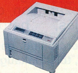
OKIPAGE 16n/20n 16/20 lap/perc 600×1200 dpi