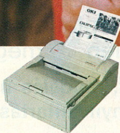
OKIPAGE 6e/6ex 6 lap/perc 600 dpi