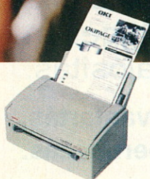
OKIPAGE 4w Plus 4 lap/perc 600 dpi