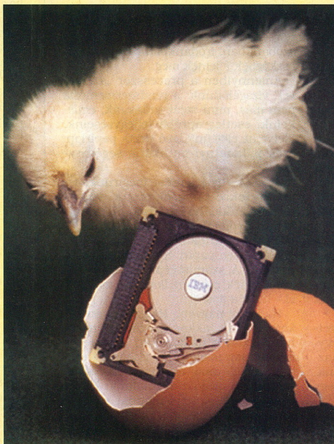
IBM microdrive: akár digitális fényképezőgépbe is