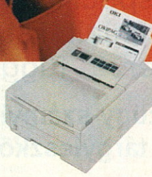
OKIPAGE 10i 10 lap/perc 600×1200 dpi